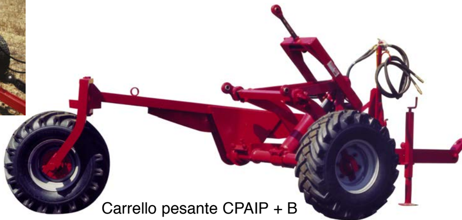
Carrello pesante CPAIP + B

I dati e le caratteristiche degli attrezzi sono indicativi e non impegnano il costruttore che può variarli senza preavviso.