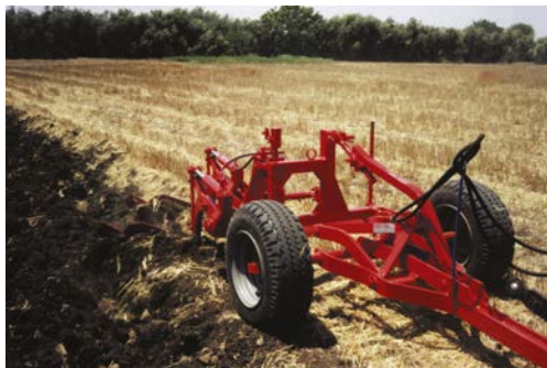
Carrello leggero CPAIL con aratro AL 2V