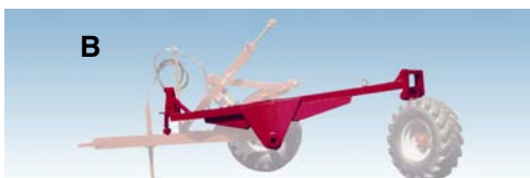
Braccio "B" di prolunga per ruota pivotante "B" extension arm for pivot wheel.