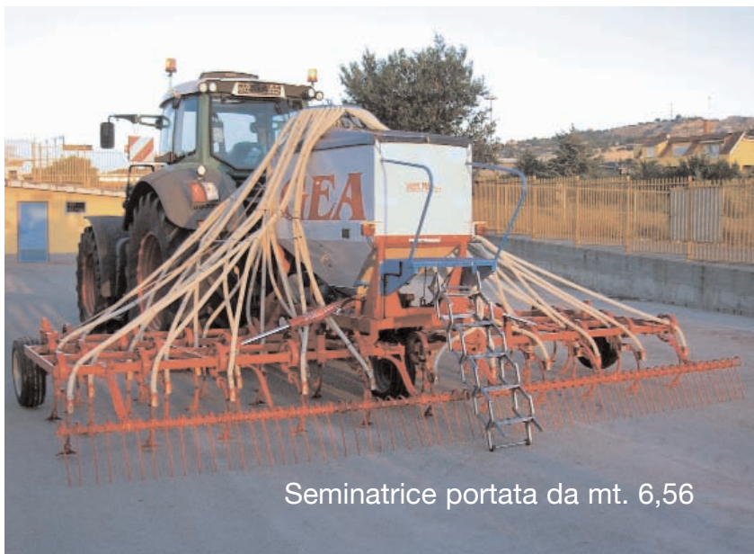
Seminatrice portata da mt. 6,56